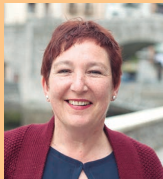
Visit Beiro Badiola BERDINTASUNA.