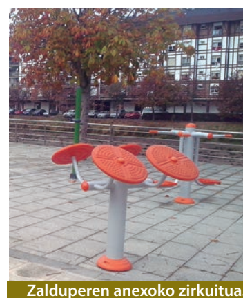
Zalduperen anexoko zirkuitua.

Ariketak eginaz osasuna zain- tzen dela eta, Ondarroako Udalak adinekoentzako beste zirkuitu bio-osasungarri bat ipini du Zalduperen anexoan. Zirkuitu hauen helburua kirola edozein adinetan egitea posible dela erakustea da. Zirkuituan, gorputzeko atal guztiak erabil- tzeko makinak ipini dituzte. Honako honekin, adinekoek bi zirkuitu daukate herrian zehar: Kamiñazpin eta anexoan.