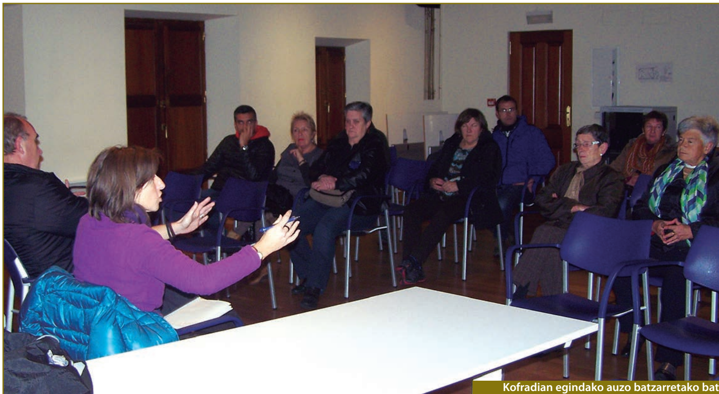
Kofradian egindako auzo batzarretako bat.

Kaleandiko proiektua da Ondarroa-ko Udalak esku artean daukan lanik garrantzitsuenetakoa. Hodiak berri egingo dira, eta, bide batez, gasa eta beste zerbitzuak sartu. Horrekin batera, igogailua ipiniko da, oraindik leku zehatza erabaki barik badago ere. Kaleandin gasa sartuta, Txori Errekan ipintzea baino ez da faltako, baina kasu horretan udalak ezin du ezer egin, konpetentzia kontuengatik (foru errepidearen albo-alboan egonik, Foru Aldundiaren ardura da).