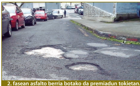
2. fasean asfalto berria botako da premiadun tokietan.

Hurrengo asteotan, Kamiñazpin hainbat lan egingo dira, eta, halan, udan amaitutako lanekin jarraituko dute. Bigarren fase honetan, goi-goiko alderdiko espaloia, hau da, botika parekoa, berriro egingo da, eta beste aldean ere lanak egingo dira: lbaiondoruntz bide berria zabalduko da, eta ingurua urbanizatu egingo da, hau da, aurreko fasean txarto geratu zen ingurua ondo ipini. Bide batez, Kamiñazpiko beheko partean dauden saneamendu arazoak konponduko dira, eta asfalto berria bota.