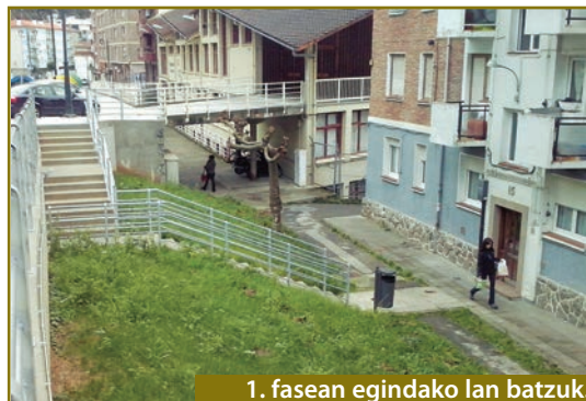
1. fasean egindako lan batzuk.