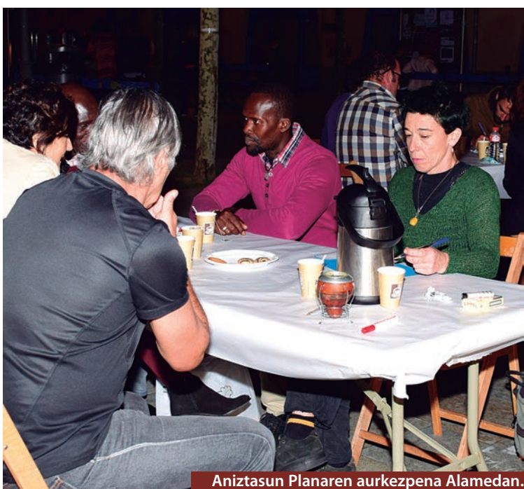
Aniztasun Planaren aurkezpena Alamedan.

Ondarroako Udaleko Aniztasun Batzordeak, Kultur komunitateen arteko eza-gutza eta harremana bultzatu nahirik, Aniztasun Plana aurkeztu eta eztaibadan jarri zuen azaroaren 6an, Word Café izenarekin antolatutako dinamikaren bidez, Alamedan. Aztiker urte hasieratik ibili da komunitateekin lanean, eta datu estatistikoekin gain, iritziak jasotzeko, ahalik eta iritzi gehien. Atera duten ondorio nagusia da kultur arteko interakzio oso txikia egon dela. "Proiektuak badaude interakzioa ahalbidetzen dutenak, baina herriratzea komeni da", azaldu zuen Aztikerrek.