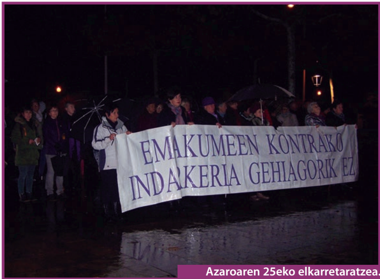
Azaroaren 25eko elkarretaratzea.

Ondarroako Emakumeen Udala Berdintasun Kontseiluak eta Ondarroako Gixon Taldeak antolatuta, abenduaren 18an, 19:00etan, Macho-Maris antzezlana eskaini zuten Etxelilan, "kode matxistetan tratuak izan arren, haien aurrean matxinatzen ahalegintzen ari diren gizonei dedikatutako ikuskizuna; autokritika eta hausnarketak umoretsua egiteko deia";