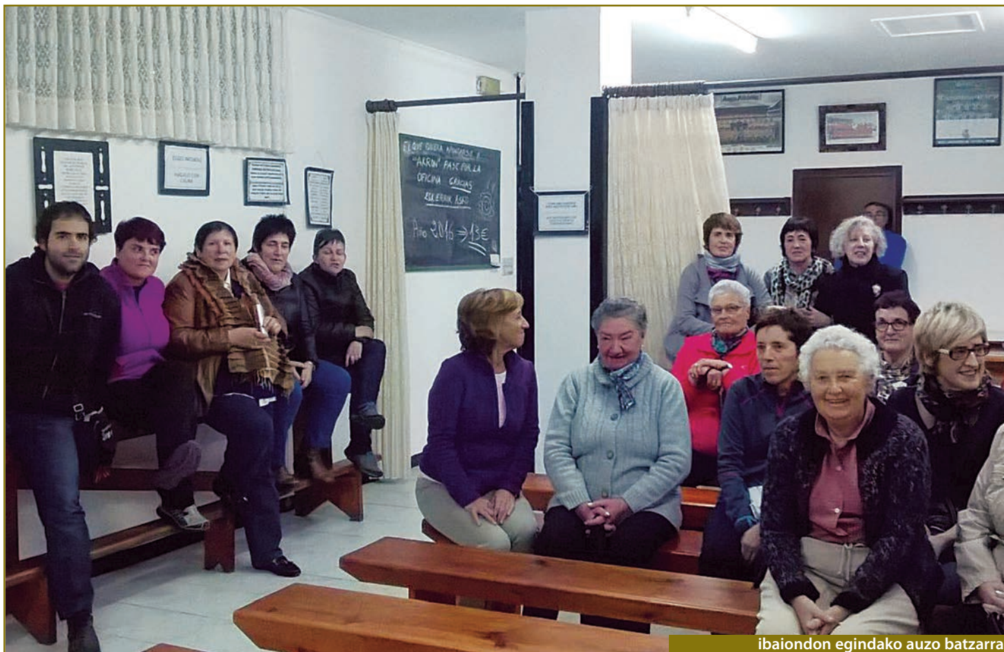
ibaiondon egindako auzo batzarra.