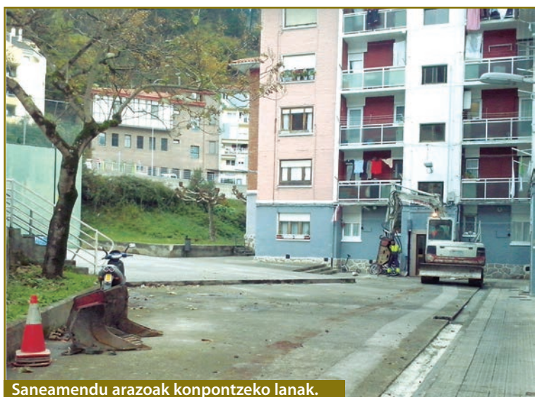
Saneamendu arazoak konpontzeko lanak.

Hurrengo asteotan, Kamiñazpin hainbat lan egingo dira, eta, halan, udan amaitutako lanekin jarraituko dute. Bigarren fase honetan, goi-goiko alderdiko espaloia, hau da, botika parekoa, berriro egingo da, eta beste aldean ere lanak egingo dira: lbaiondoruntz bide berria zabalduko da, eta ingurua urbanizatu egingo da, hau da, aurreko fasean txarto geratu zen ingurua ondo ipini. Bide batez, Kamiñazpiko beheko partean dauden saneamendu arazoak konponduko dira, eta asfalto berria bota.