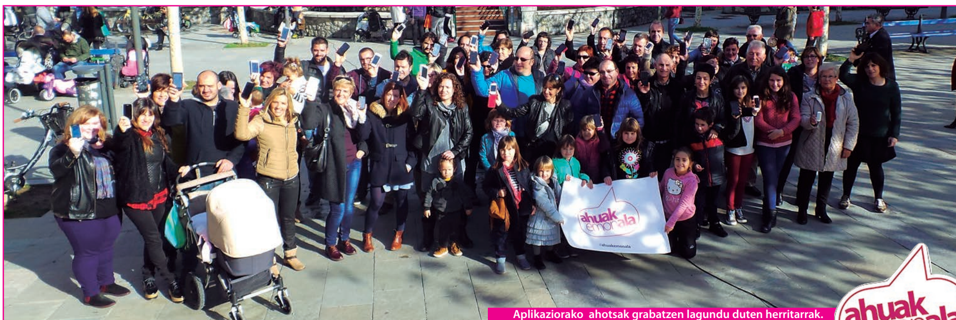
Aplikaziorako ahotsak grabatzen lagundu duten herritarrak.