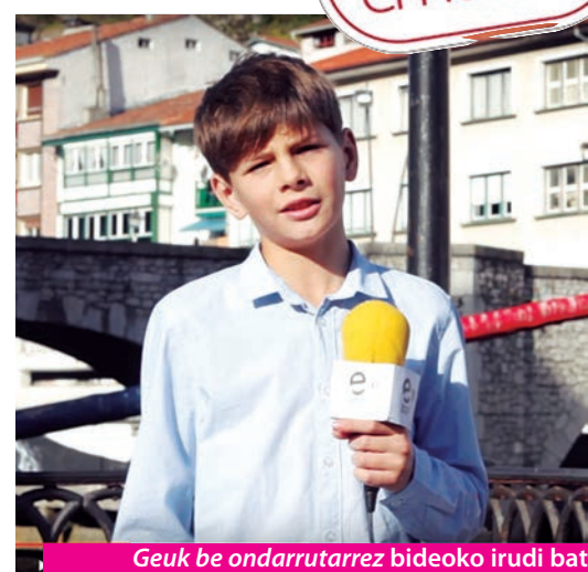
Geuk be ondarrutarrez bideoa irudi bat.

Bigarren urtez jarraian, Ondarroako Udaleko Euskara zerbitzuaren eskariz, bideoa prestatu da Euskara Egunari begira, Ondarroara etorri eta ondarrutar egiten duen hainbat lagunentzako testigantzekin, euskara eurenganatu dutenekin. Bilbo, Madrid, Pakistan, Txina, Moldavia, Aragoi eta Senegaleko jendea agertzen da berbetan, besteak beste, euren ama hizkuntzan zein ondarrutar. Bideoa youtubetik jaitxi daiteke, "geuk be ondarrutarrez" idatzita. Milaka lagunek ikusi dute.